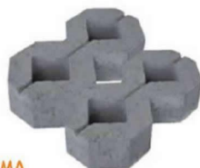
PISO DRENANTE PISOGRAMA

Resistência: Os pisos permeáveis da TECMOLD são produzidos com resistências de 25 MPa.