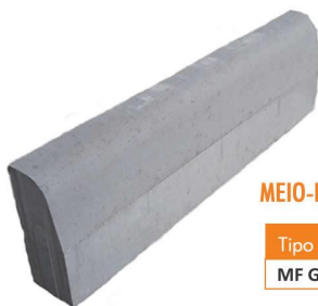
MEIO-FIO GARDEN MFC06